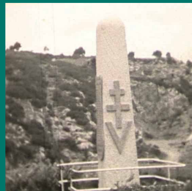
↑ Stèle de Fontjun