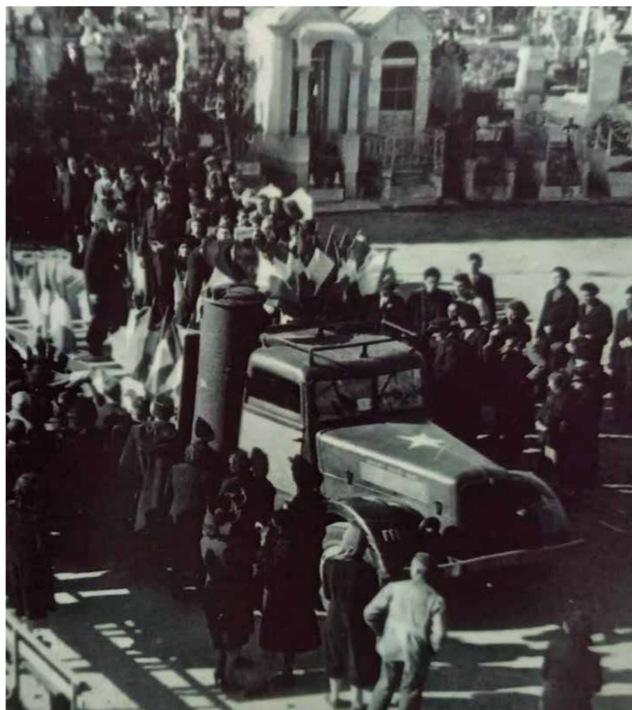
↑ Enterrement des victimes

Les rescapés se sont peu exprimés ou très tardivement et on les a trop peu interrogés. Depuis l'automne 2022, l'équipe de l'Atelier H s'est rapprochée des familles concernées, a récolté les témoignages