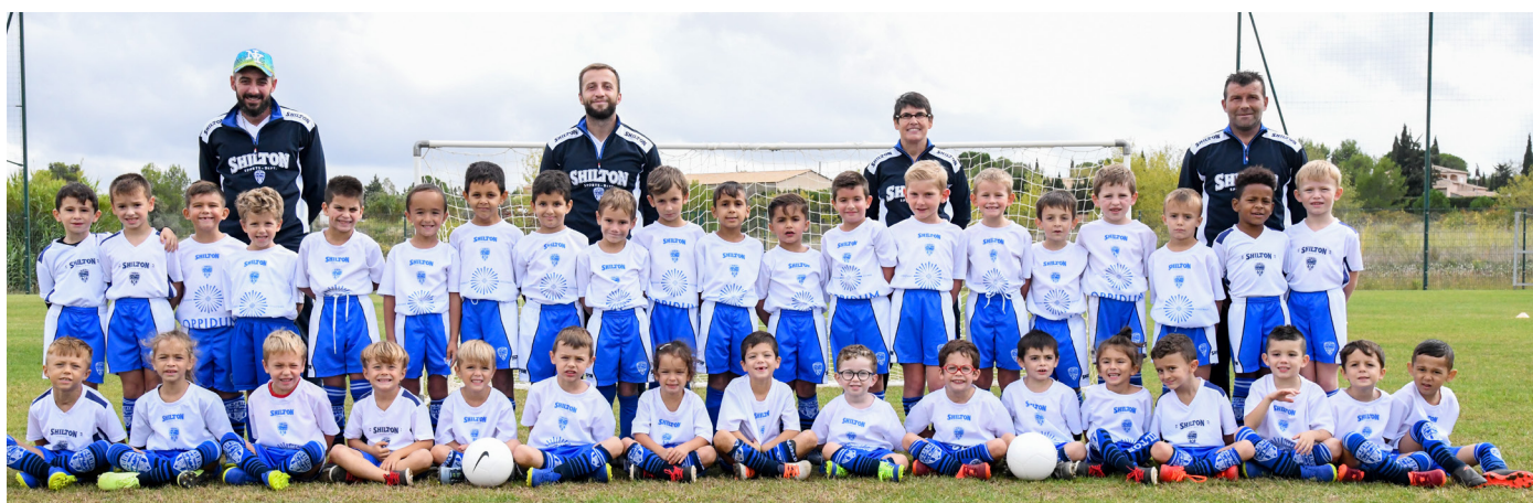
▲ Ci-dessus, comme chaque année, les tout petits du FOSH, catégorie U6-U7 version 2022-2023

Nous sommes toujours à la recherche de personnes souhaitant nous apporter leur aide et leur soutien. Pour tous renseignements contactez le 06.64.75.24.74